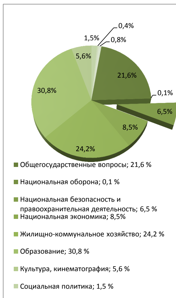
Сравнительная таблица исполнения доходов и расходов бюджета муниципального образования ЗАТО г. Островной за 2008-2016 годы